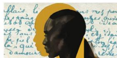
Mohamed Mbougar Sarr La plus secrète mémoire des hommes